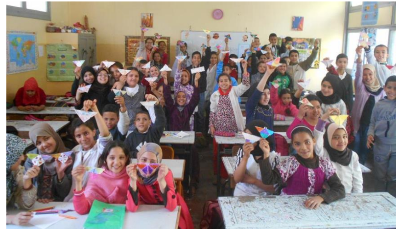
Activité de sensibilisation à l'école par JOCV (Maroc)