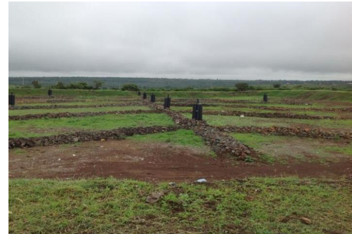
La décharge semi-aérobique de Kang'oki à Kiambu, Kenya