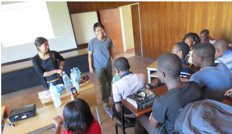
Atelier sur le compostage par JOCV (Mozambique)

* Japan Overseas Cooperation Volunteers (JOCV) : jeune volontaire professionnel envoyé par la JICA, affecté aux pays en voie de développement pendant 2 ans pour vivre avec les communautés locales