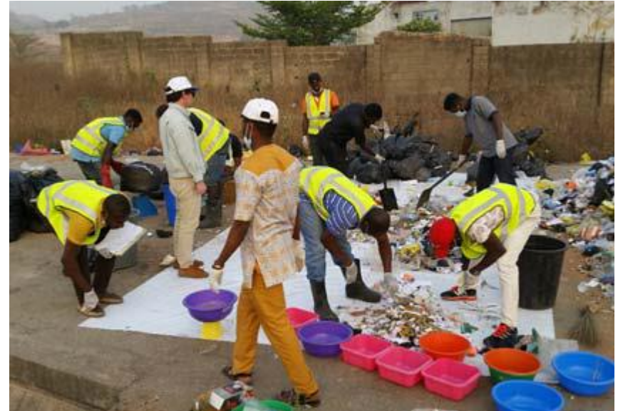
Enquête sur les composantes des déchets ménagers