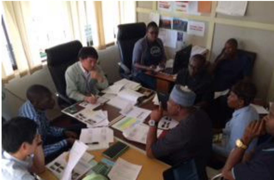
Atelier sur l'étude pilote à Abuja