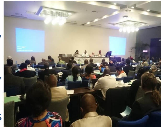
16ème AMCEN à Libreville, Gabon